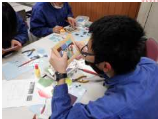
技能士会授業 アートモザイク

○アートモザイクでどんなことを感じましたか？ 初めてやってみましたが、タイルを割るのが難しかったです。理想まではいかなかったけれど、自分のつくりたいものをタイルで自由に表現するという楽しさがあって良かったです。