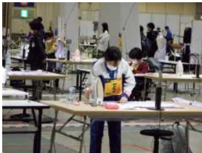
縫製種目 大会風景

○ アビリンピックで学んだことを教えてください 私は今回銀賞を取ることができました。練習を続けていくことの大事さを学びました。