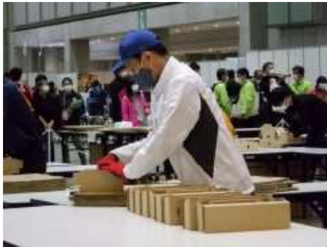
製品パッキング種目 大会風景