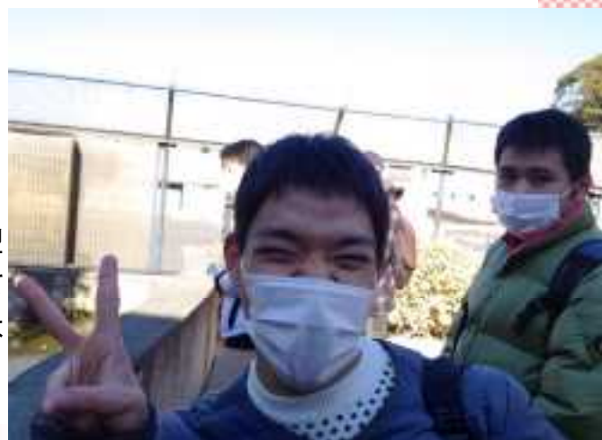
社会見学 動物園見学

○社会見学でどんなことを学びましたか？ 日本平ホテルでコース料理のテーブルマナーを教わりました。初めて知るマナーがあり、良い経験ができて良かったです。