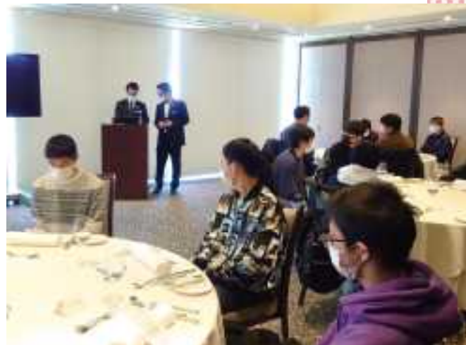
日本平ホテル マナー講習