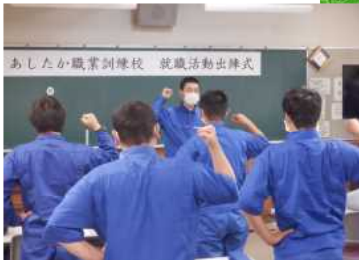
出陣式の頑張ろう三唱