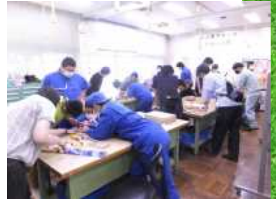
オープンキャンパス 加工組立コース 体験風景

来てくださった多くの方が「ありがとう」や「良かった」と言ってくださり、 感謝される喜びを学びました。