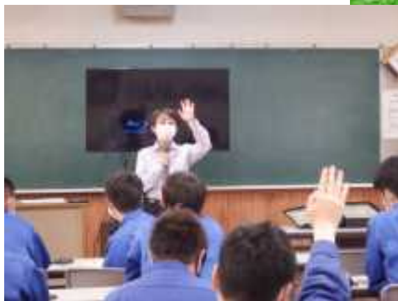
防犯講話 講話風景

○今後どんなことに注意していこうと思われましたか？ インターネットで知り合った相手には簡単に個人情報を教えてはいけないと改めて思いました。