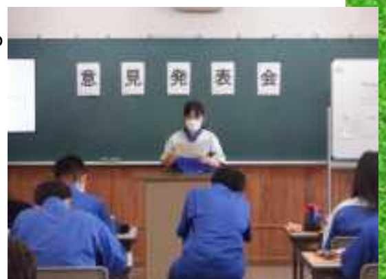
意見発表会 発表風景

自分の意見を信念を持ってしっかりとと言える社会人、 そして作文にかいたような社会人になりたいと思います。