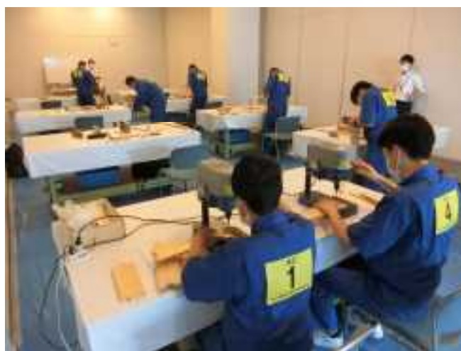
アビリンピック県大会 木工競技