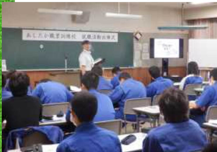
しずおかジョブステーション センター長による講演

9月からは本格的な就職活動が始まります。就職を「勝ち取る」気持ちを高めるため出陣式を行い、外部講師による講演では、日頃の姿勢、面接などとても重要な話が聞けました。