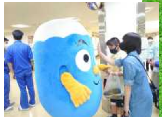
オープンキャンパス ふじっぴー 触れ合い

7月16日、『自分にとって働くとは』をテーマに意見発表会を行いました。進行係やタイム管理係など、作業を分担しみんなで協力して意見発表会を成功させました。