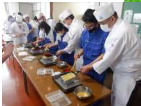
調理実習 調理作業

○今回の実習でどんなことを学びましたか？ 卵焼きの作り方を学びましたが、大人の接し方、調理の楽しさも学びました。今後も調理実習があったら、またやりたいです。