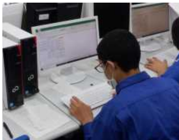
パソコンデータ入力 練習風景